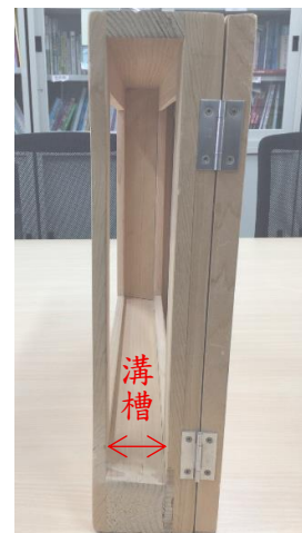
圖三 插入圖畫紙張的溝槽

九、故事題材提供者：《福娘童話集》（ http://hukumusume.com/douwa/ 、網站管理者：福娘）